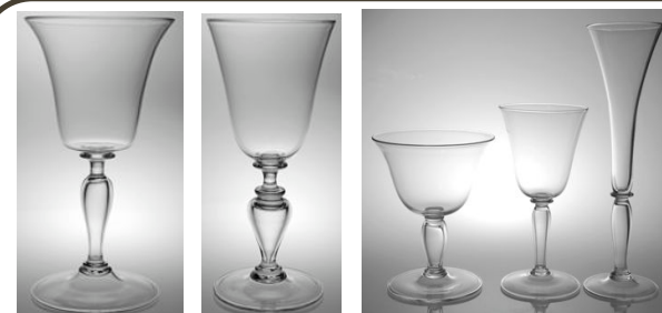
ELVIRE ELEONORE CASSANDRE