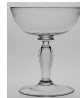
Verres aux formes harmonieuses à la façon de Venise (coupe fine et jambe creuse) alliant légèreté et raffinement.