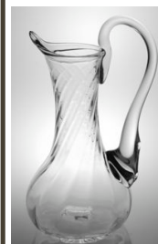
Des aiguières et pichets au service de l'eau ou du vin

Verreries des Lumières vous propose des collections de gobelets, verres et autres objets pour la table, aux lignes intemporelles et élégantes. Ces témoins raffinés s'invitent à votre table, au quotidien ou pour les grandes occasions.